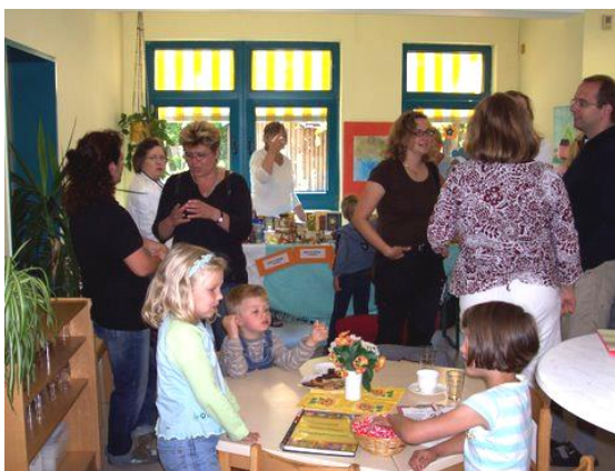
Das Familienzentrum ist ein Treffpunkt für Eltern und Kinder- hier beim „Offenen Café“.

Nähere Informationen zu den auf der Rückseite aufgeführten Kooperationspartnern finden Sie im Eingangsbereich in unserer Kindertagesstätte.